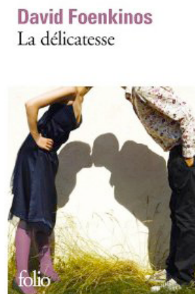
La Délicatesse David Foenkinos

Pour voter : il vous suffit de déposer la fiche du livre que vous sélectionnez dans l'urne au CDI et d'émarger (avant le 11 mai 2012)