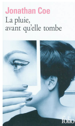
La Pluie, avant qu'elle tombe Jonathan Coe

Pour voter : il vous suffit de déposer la fiche du livre que vous sélectionnez dans l'urne au CDI et d'émarger (avant le 11 mai 2012)